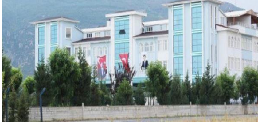
Şekil 1. Akşehir Mühendislik ve Mimarlık Fakültesi Binası